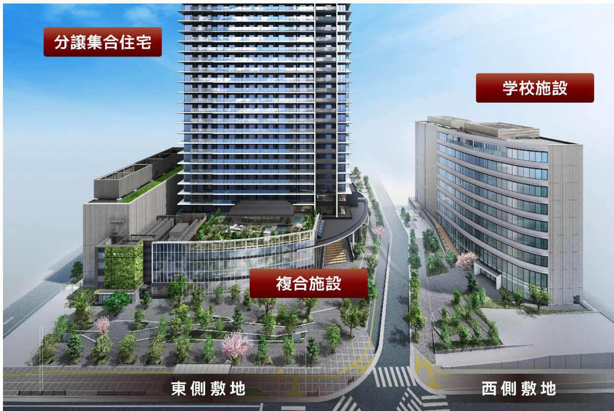
プロジェクト全体図

また本プロジェクトは、大阪市が実施した「もと淀川区役所跡地等活用事業」において阪急阪神不動産株式会社および当社が事業者を選定され、十三の新たな発展とにぎわいを創出する地域共創型プロジェクトとして「官・民・学」が一体となって進めてきた開発事業です。施設は東西2つの敷地から構成されており、西側敷地には当社にて設計・施工を手掛けた学校法人履正社が運営する医療系専門学校が2024年4月に開校しています。東側敷地においては、712戸の超高層タワーレジデンス「ジオタワー大阪十三」をはじめ、図書館、保育・学童施設、スーパーマーケットなど、新たな生活環境が整備されます。