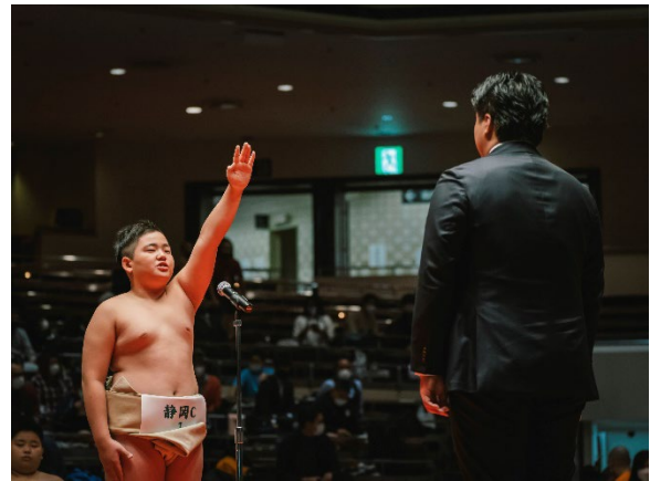
去年の大会の様子