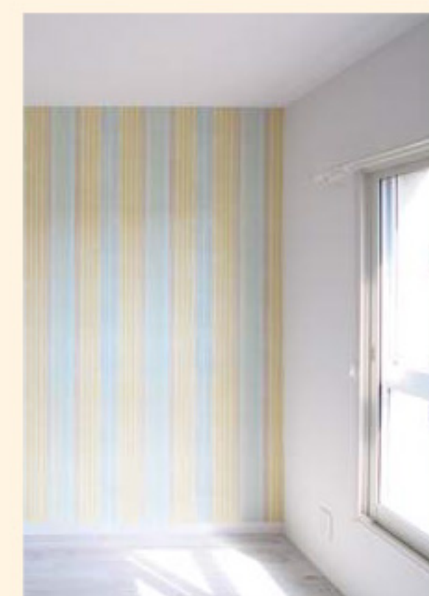
明るい壁紙で印象アップ

女性に好かれる部屋をつくるには、何を考えるべきでしょうか。おすすめは、まず、「部屋に住む方を想定する」こと。年齢や職業、そして年収を想定します。たとえば、社会人5年目の20代後半女性。ではその彼女は住まいに何を求めるかを考えます。水回りがキレイで便利なのはもちろん、仕事熱心な女性であれば、リラックスできる大きめのお風呂がうれしいでしょうし、ひとり暮らしでも、2口コンロでシンクの広いキッチンで料理を楽しみたいでしょう。そういった想定から、部屋づくりの方向性が見えてきます。次に、「第一印象にこだわる」。たとえば部屋の色使いです。色は