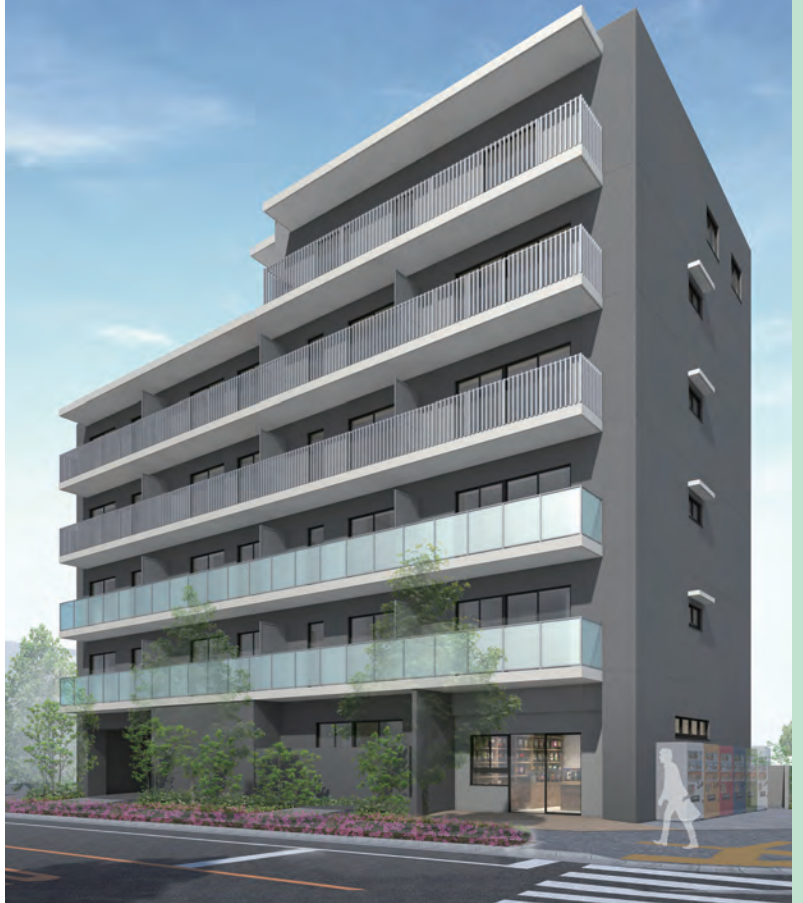
完成イメージパース