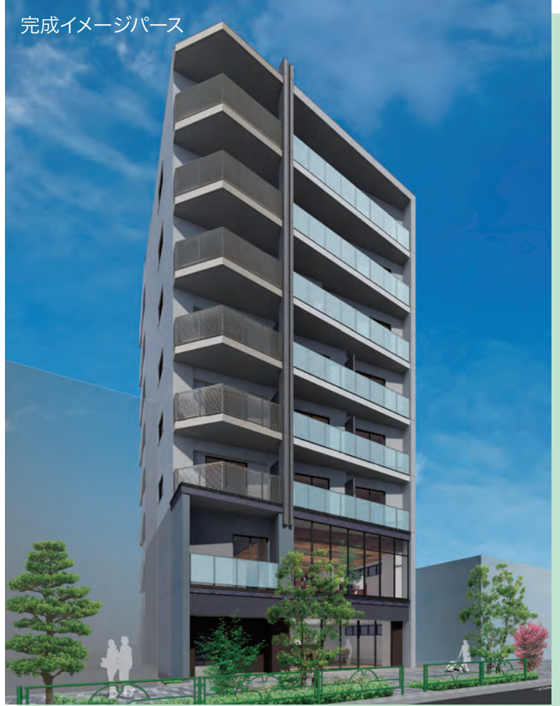
完成イメージパース

エントランスホールはガラススクリーン、アルミスパンドレルにより特徴的な空間としました。住戸内のカラーテイストは3タイプあり、単身層やファミリー層それぞれの間取りに対応しています。